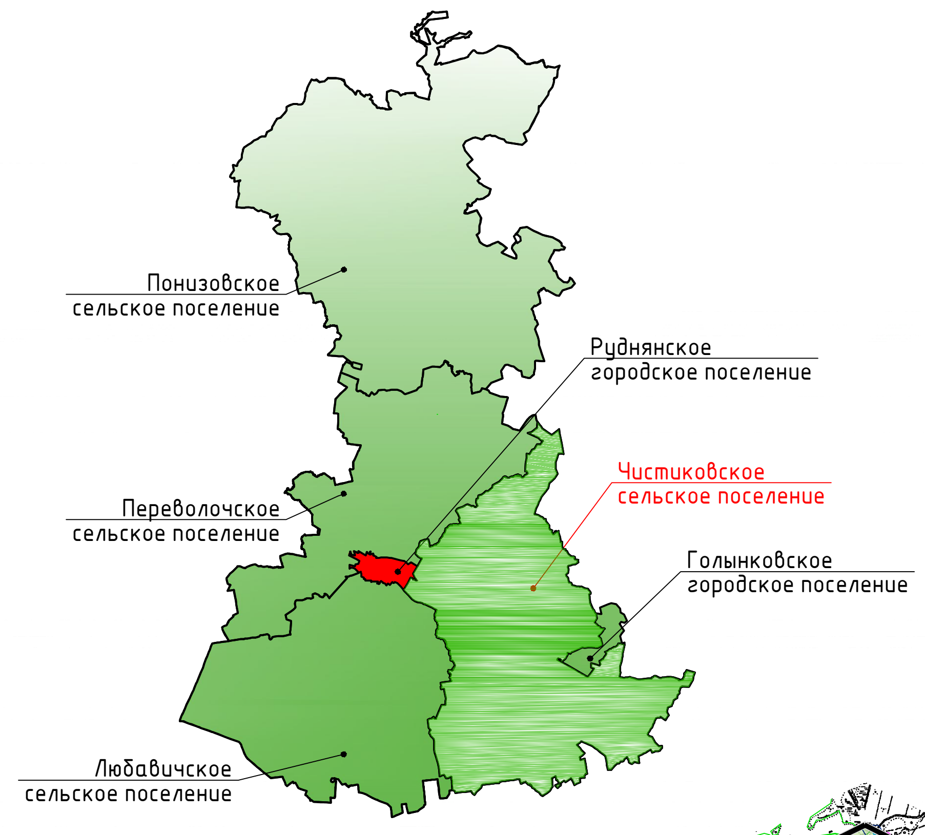
1 Схема расположения Чистиковского сельского поселения Руднянского района Смоленской области

Карта границ населенных пунктов (в том числе границ образуемых населенных пунктов), входящих в состав поселения. М 1:25000.